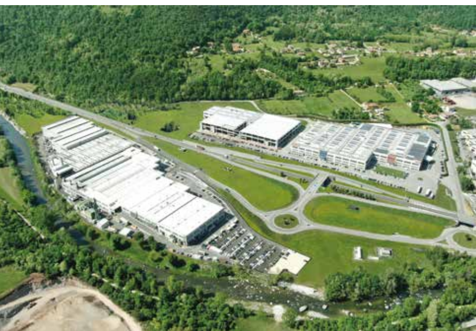
Производственные площадки Fondital Spa в г. Карпенедра ди Вобарно (Брешиа, Италия)