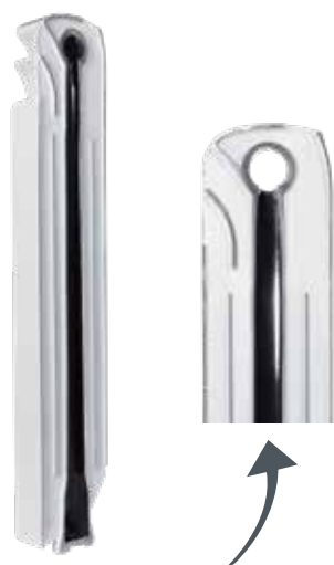
Внутренняя обработка Aleternum® компании Fondital

Коррозия – это основная причина повреждений отопительной системы. Со временем находящаяся в контакте с водой поверхность металла подвергается разрушительному действию коррозии и приводит к значительному снижению эффективности системы с одновременным увеличением затрат. Например, коррозия в системе, состоящей из стальных или чугунных радиаторов, приводит к появлению отложений на дне радиатора, которые засоряют трубы и сами радиаторы, что приводит к частичному либо полному снижению теплоотдачи и перепадам в распределении тепла. В обычных алюминиевых радиаторах коррозия приводит к образованию газовых скоплений (воздушные пробки), которые не позволяют радиатору разогреться равномерно и могут снизить его теплоотдачу. Во избежание появления коррозии компания Fondital изобрела Aleternum®: эксклюзивную обработку внутренней поверхности радиатора на основе смолы для защиты его водяной камеры. Радиаторы Fondital с обработкой Aleternum® представляют собой новую эру тотальной защиты и являются синонимом безопасности и высоких показателей теплоотдачи. Ваша система отопления всегда будет как новая!